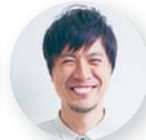
料理研究家 コウケンテツさん