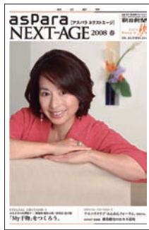
2008年3月 タブロイド判