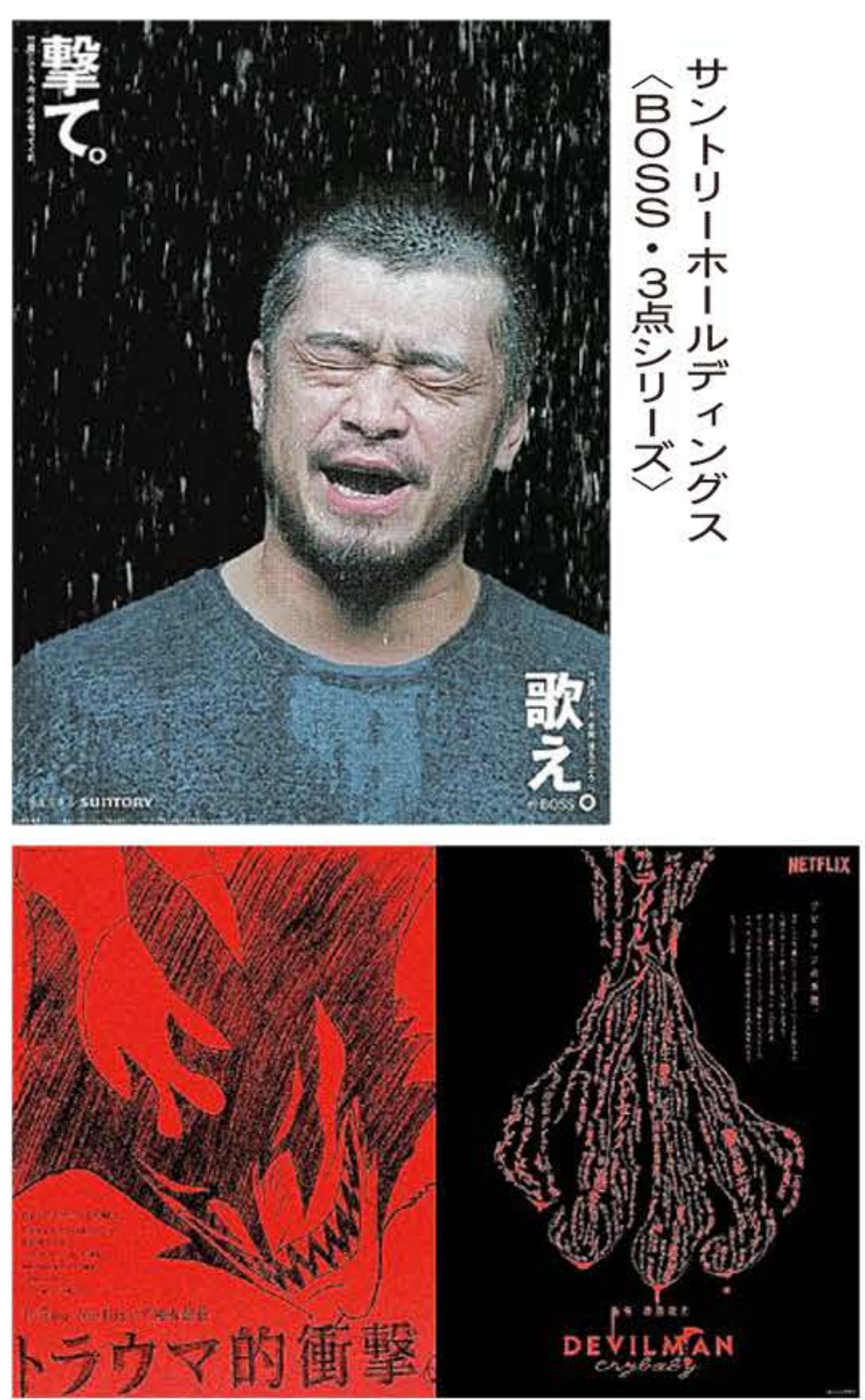
NetfliX <DEVILMAN crybaby “トラウマ的衝撃。” “デビルマンの系譜”>