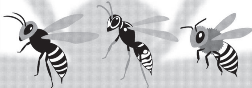
スズメバチ アシナガバチ ミツバチ