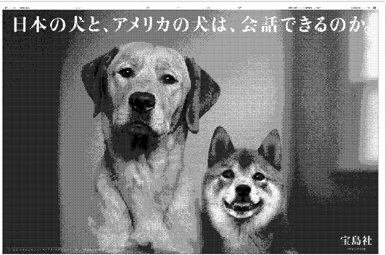
2010年9月2日付朝刊掲載 全30段 宝島社