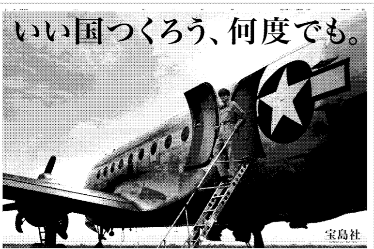
2011年9月2日付朝刊掲載 全30段 宝島社