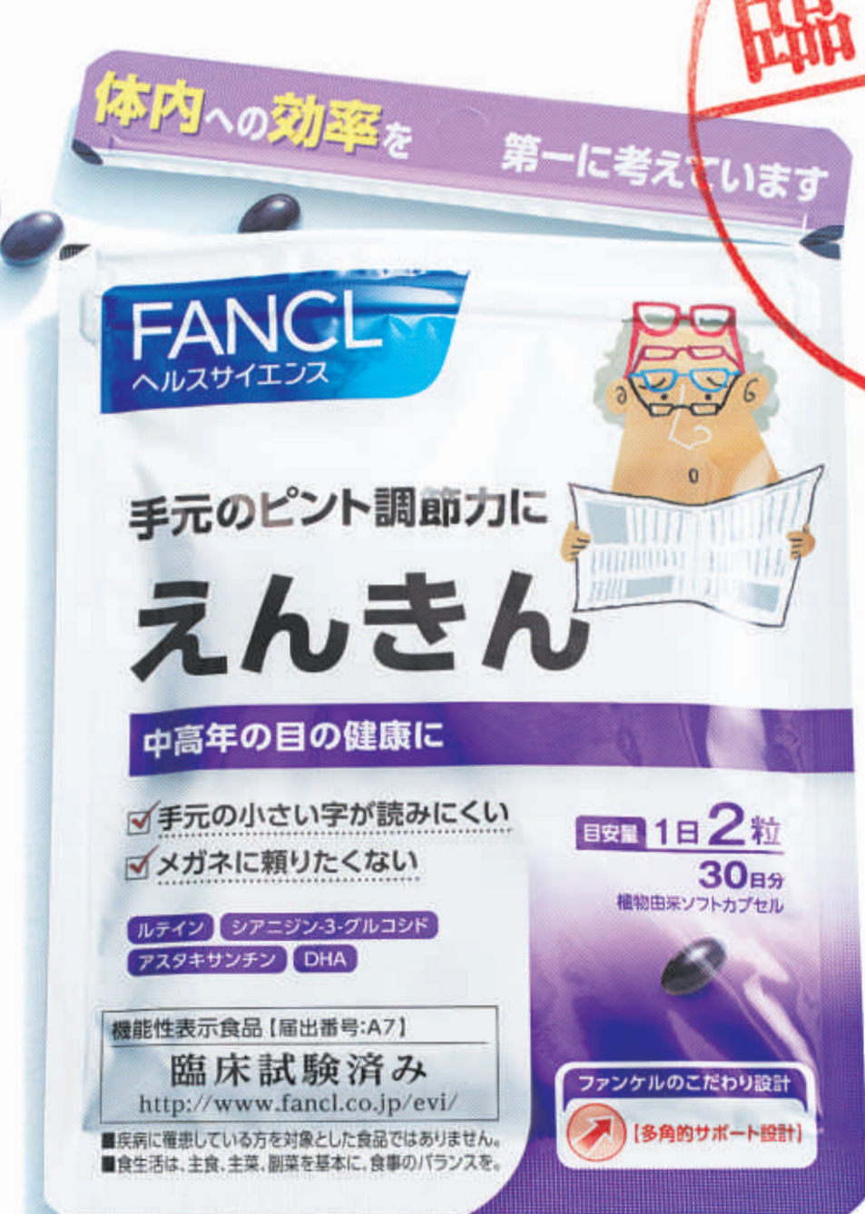
機能性表示食品【抽出番号:A7】 60粒入り(30日分) 2,160円(税込) 商品番号:5391 ●えんきんにはルテイン・アスタキサンチン・シアニジン・3-グルコシド・DHAが含まれるので、手元のピント調節機能を助けると共に、目の使用による肩・首筋への負担を和らげます。【アレルギー物質:大豆】