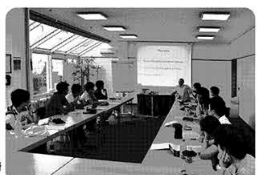
TLPの海外語学研修の様子(ドイツ)

「グローバルリーダー育成プログラム」の一環として、2013年に教養学部で発足したのが「トライリンガル・プログラム(TLP)」。グローバル社会において高度な英語力は必須だが、TLPはそれに加えてもう一つの外国語の高い運用能力を集中的に習得するための教育プログラムで、入学時に高い英語力を持つ学生の中から、希望者を対象に行われる。