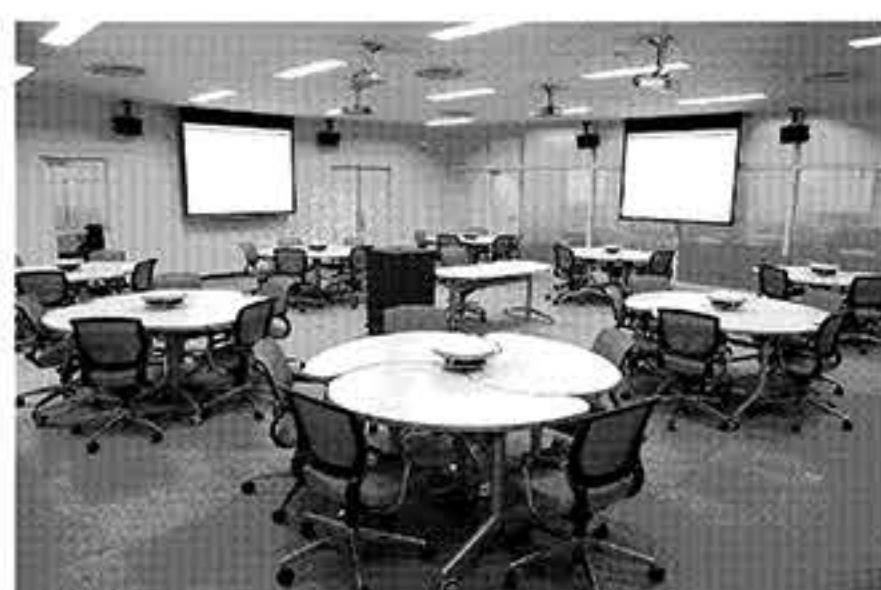
ICT支援型協調学習教室 KALS

クラス。科学論文冒頭のタイトル・アブストラクト(要約、要旨)がいかに重要であるかなど、執筆する際のポイントや作法を学ぶ講義が行われた。