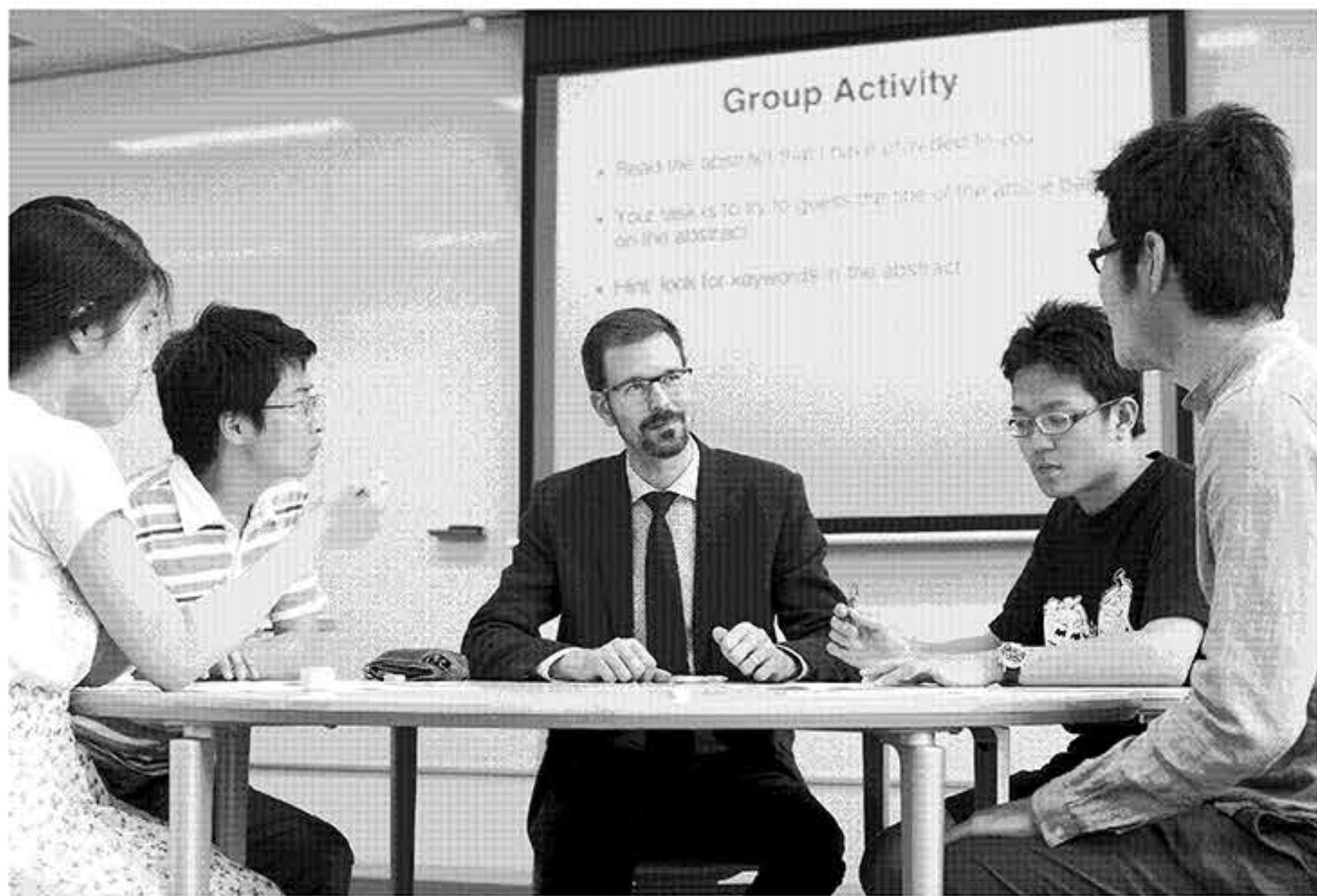
ALESSのグループアクティビティでは英語での活発な議論が行われる