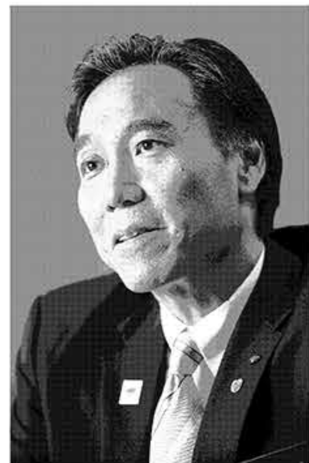
阿部守一 長野県知事