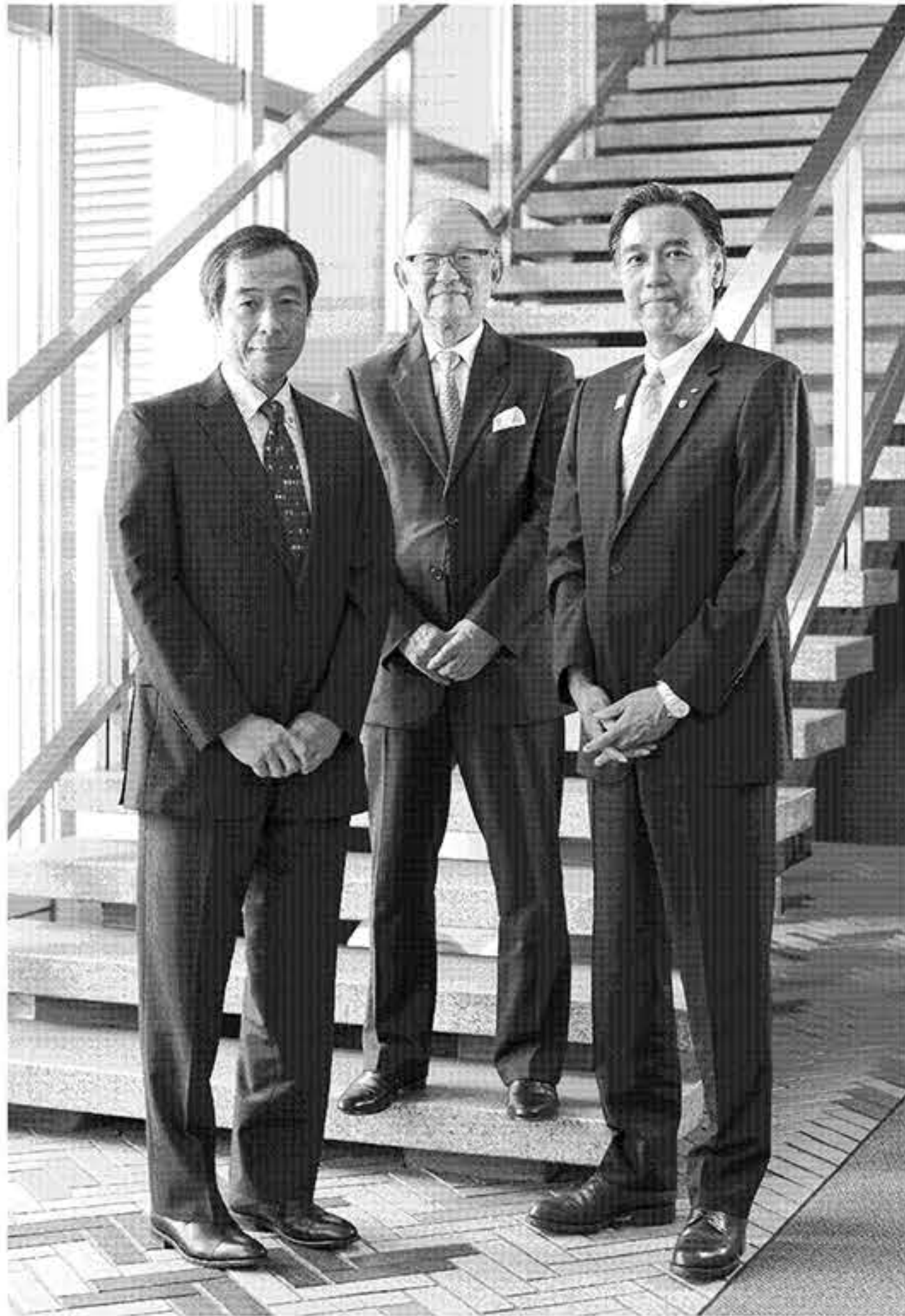
学長、理事長、知事がそれぞれの英知を長野県立大学に注ぎ込む

長です。前者は学部間で、16人程度のクラスで大学教育に必要な基礎能力を高め合うプログラム。自分の意見を的確な言葉で伝え、相手の意見も尊重する