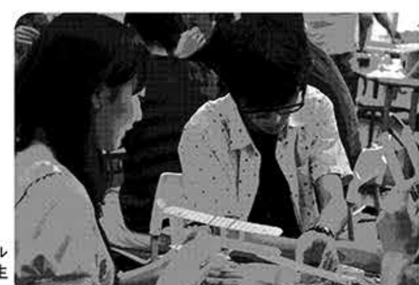
初年次ゼミナールで課題に励む学生たち

初年次ゼミナールは、「教え付ける(ティーチング)」から「自ら学ばせる(ラーニング)」への転換を目指した教育プログラム。入学して最初の学期に開講される、文系・理系全学生の必修科目だ。