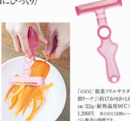
「ののじ 根菜フリルサラダ削り〜ナ」(約176×9.8×1.6cm/22g/耐熱温度90℃) 1,200円 ※ののじは株式会社レーベン販売の商標です。

うさには聞いていましたが、「ののじ 根菜フリルサラダ削り〜ナ」を使ったのは初めて。でも、軽く持ちやすく、硬いごぼうも刃いらすずすーと削れました。刃に当てる角度でスライスの大きさも厚みも手問いらずで調整できたり、断面が美しいのは料理するものにとってはウレシイ利点! 短時間で味もからまりあって、調理の強い味方を見つけた気分です。